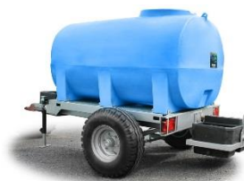
Figure 1 - Tonne à eau (exemple)

Afin de se mettre en conformité avec la réglementation et d'éviter des allers-retours entre les points d'arrosage et le square d'Aumale, il est proposé au Conseil Syndical l'achat d'une tonne à eau routière d'une capacité de 1.500 litres (avec freinage à inertie).